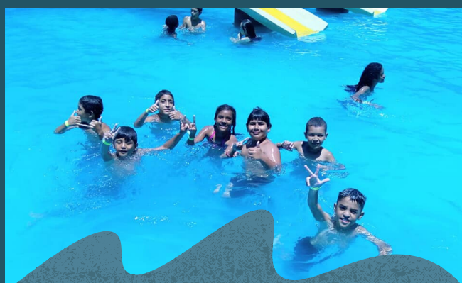
Passeio nas piscinas - Dezembro de 2019