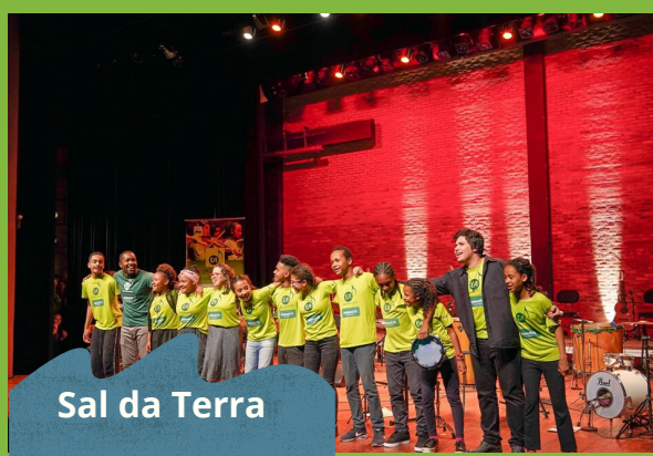
Sal da Terra

Anualmente a Aldeia promove sua tradicional Festa Julina, momento de integração com a comunidade e possibilidade de arrecadar fundos para a manutenção das atividades. Na ocasião os frequentadores têm acesso à uma série de brincadeiras e comidas típicas. A festa julina é uma das dezenas de comemorações que acontece no decorrer do ano na instituição.