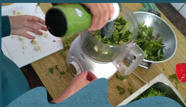
Fomação para reaproveitamento de alimentos com equipe da cozinha.