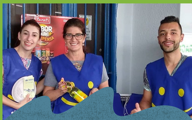
Voluntários do Sábado Solidário. Ação mensal em prol da Aldeia