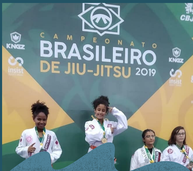
Atletas da Aldeia participaram do Campeonato Brasileiro de Jiu-jitsu