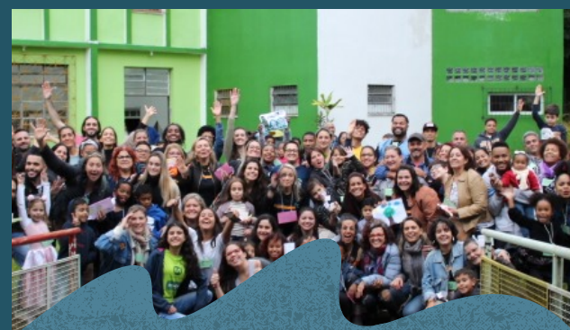
Festa da família 06/2019