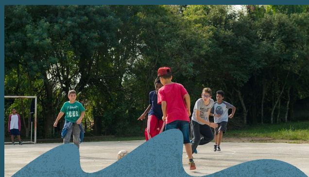
Atividades físicas para o SCFV -