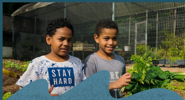
Entre as atividades propostas está o plantio, a colheita na horta e a compostagem.