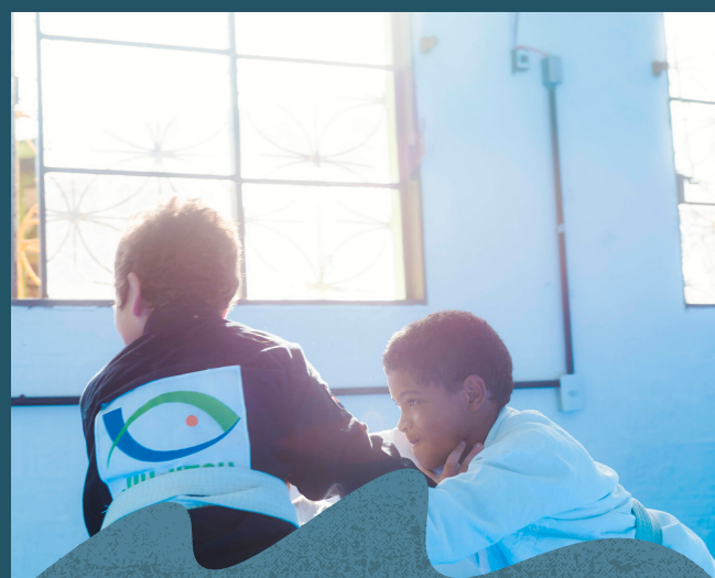
Treinos semanais na Aldeia

Saiba mais sobre o Eixo Esporte e Lazer *