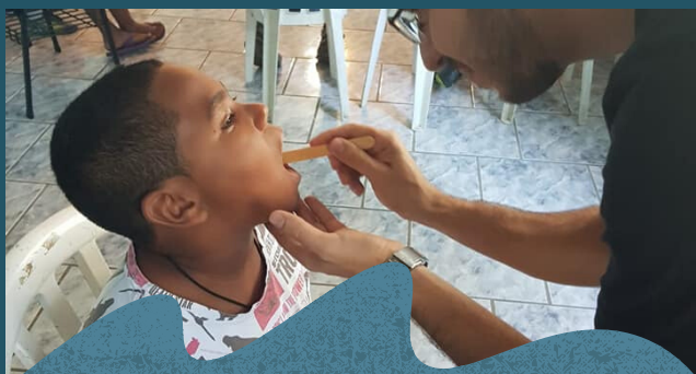
Exames preventivos com o posto de saúde.