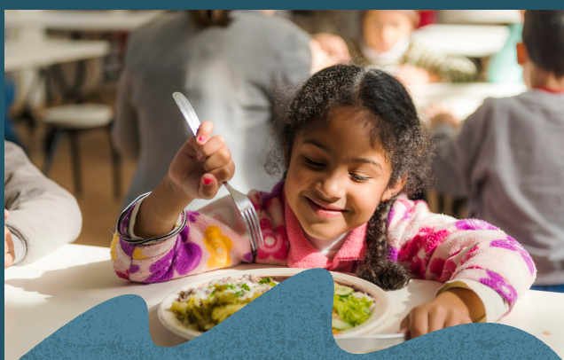
As crianças são incentivadas a conhecer novos sabores.