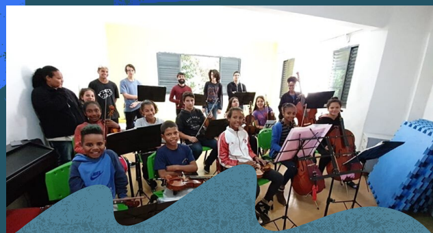
Ensaio - Maio de 2019.