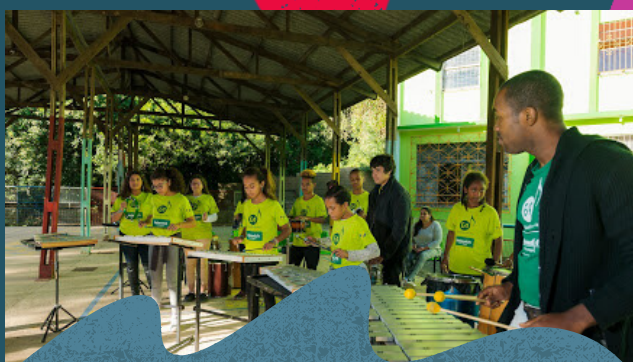
Apresentação do grupo de percussão - Junho de 2019