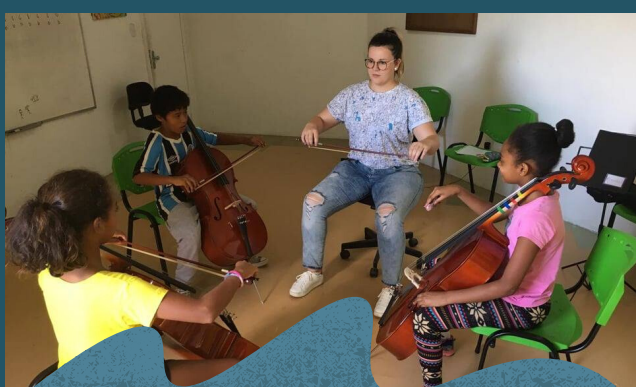
As oficinas acontecem diariamente na Escola de música na Aldeia.