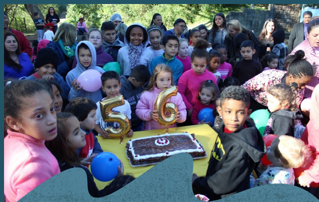
Comemoração dos 56 anos da Aldeia 06/2019