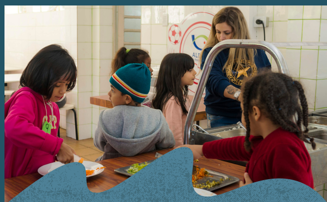
São servidas mensalmente cerca de 21 mil refeições.

Saiba mais sobre os processos de alimentação: Clique aqui