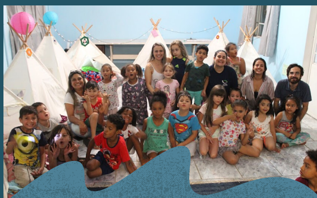
"Acampadentro" - 12/2019