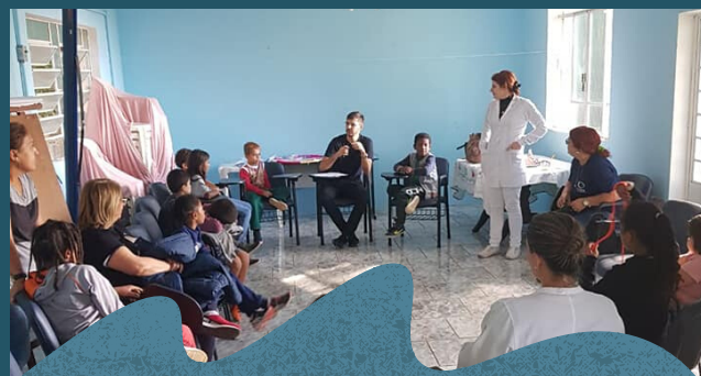
Palestras com o posto de saúde para os adolescentes