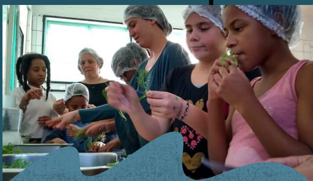
Atividades diárias para o SCFV - Oficina de reaproveitamento integral dos alimentos