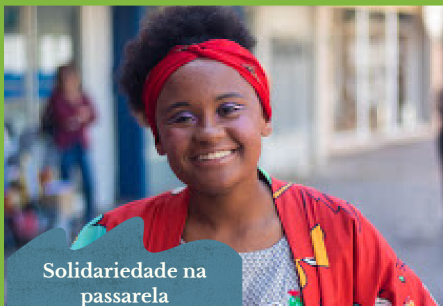
Solidariedade na passarela

Anualmente, realizamos eventos que visam ampliar a visibilidade da marca, mobilização de recursos e o relacionamento com a comunidade. Solidariedade na Passarela: Solidariedade na Passarela é um evento promovido pelo Bazar da Aldeia Fraternidade.