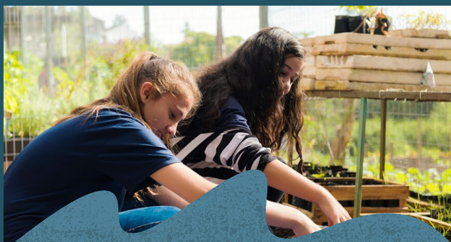
Atividades do Eixo Educação para Sustentabilidade no SCFV.