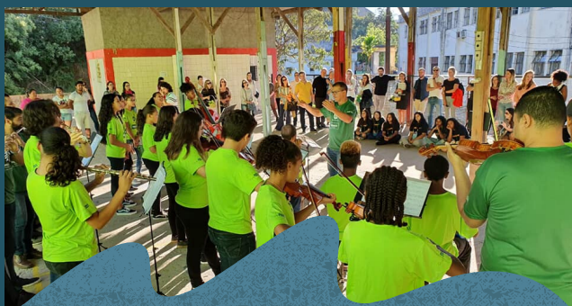
Apresentação da orquestra na inauguração da Escola Aldeia Lumiar - Março de 2019.