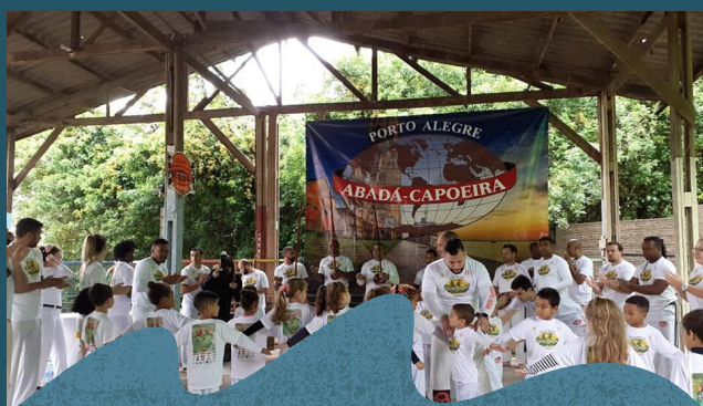
Troca de cordas na capoeira.