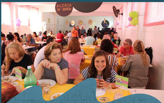
Almoço do Bem - 04/2019