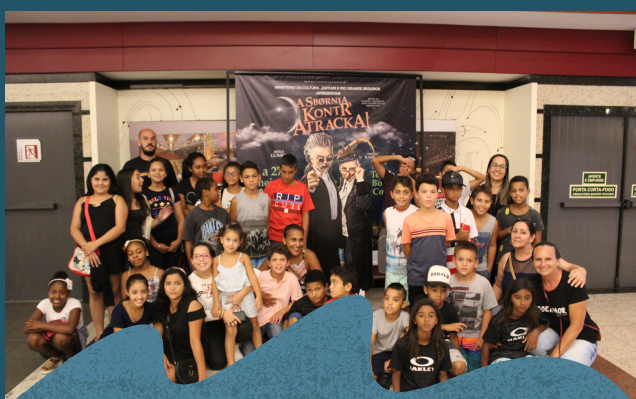
Passeios para assistir peça de Teatro - Janeiro de 2019.