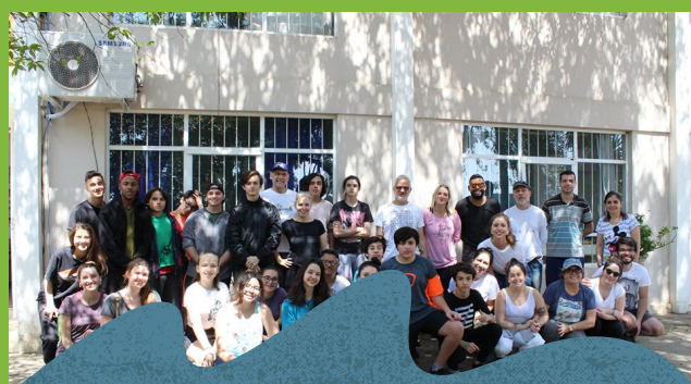
Voluntários do mutirão de pintura - prédios da educação infantil.