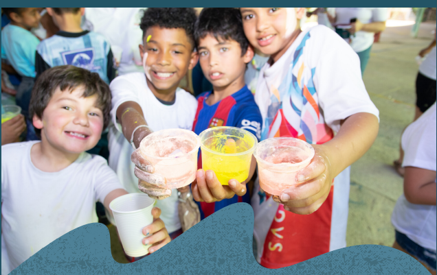
Festa das cores 11/2019