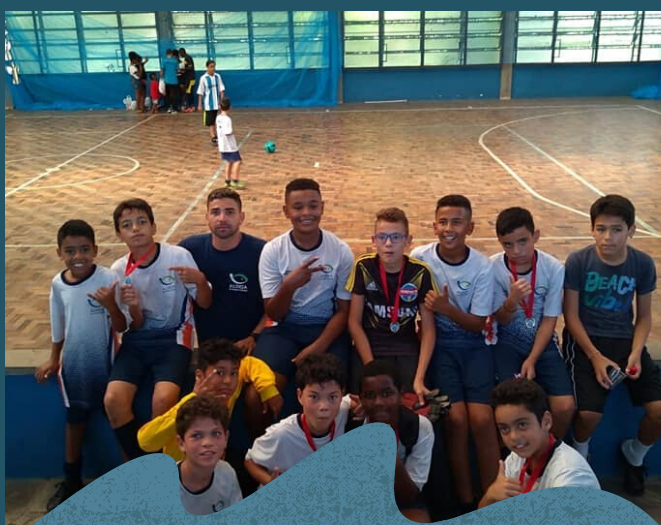
O Time de futsal da Aldeia foi campeão do campeonato entre escolas e instituições.