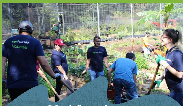
Mutirão na horta Colaboração dos voluntário da SAGE.

Atualmente contamos com o trabalho de 59 voluntários que atuam em diferentes frentes. As atividades desenvolvidas pelo voluntariado contribuem diretamente para a sustentabilidade da Aldeia. Os voluntários atuam em eventos, Sábado Solidário, Bazar da Aldeia, Brechó, no manejo dos serviços da estufa e hortas e em diversas atividades artísticas, culturais e educacionais oferecidas diariamente para os bebês, crianças e jovens.