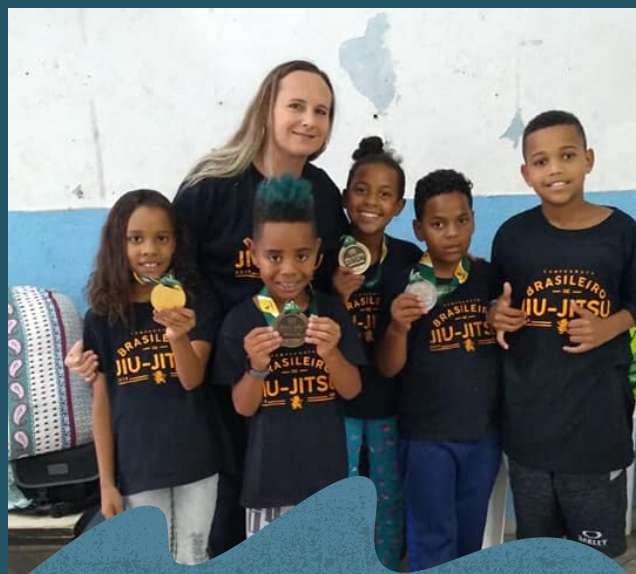
Atletas Medalhistas da Aldeia