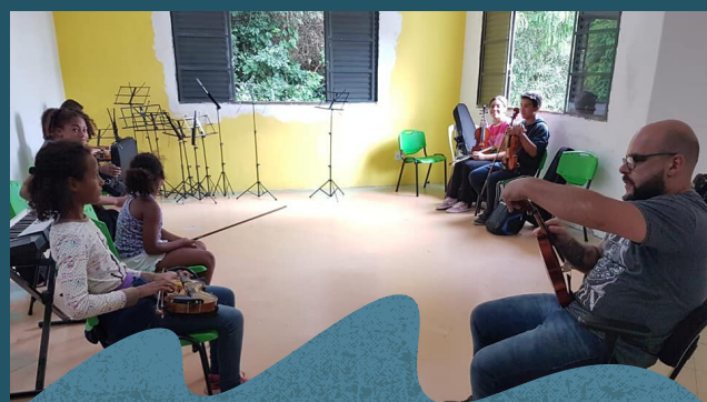
Oficina de cordas