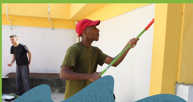
Mutirão de pintura dos prédios da educação infantil