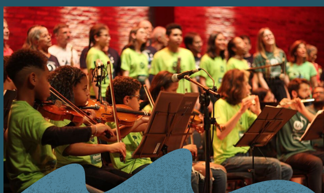
Espectáculo Sal da Terra

Saiba mais sobre o projeto Educando com Arte * que acontece na Aldeia em parceria com a EArte.